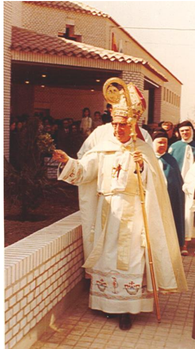
El Sr. Obispo bendiciendo la fachada del Monasterio

“Hablar de silencio es hablar de Dios, es dejar que Él nos hable, es vivir cercanamente su presencia, porque el silencio es portador de Dios”