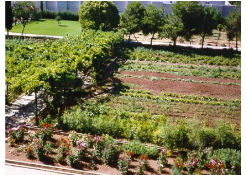
JARDINES, ERMITAS Y HUERTA DEL MONASTERIO