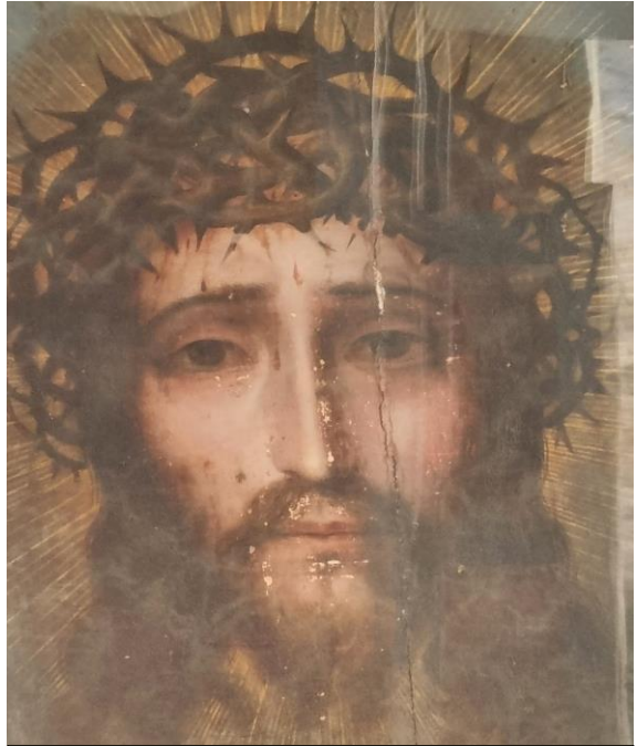
Imagen venerada en el Monasterio de Monjas Concepcionistas de Santa Inés, México

Ante la consideración de este amor divino, reflexionemos, hermanas, el nuestro: comparándolo con el de Dios, sabiendo que estamos