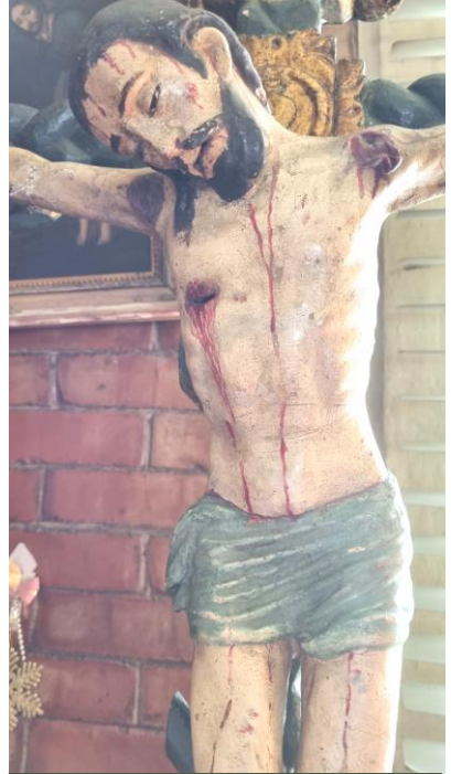
Imagen venerada en el Monasterio de Monjas Concepcionistas de San José de Gracia, México

Pues esto mismo nos sucede a nosotras. Nuestro ser es como un vaso que, desde el pecado original quedó manchado o cargado de veneno. Nuestros pecados personales han hecho crecer el volumen del veneno dentro del vaso. ¿Cómo cargarlo ahora de ese líquido divino que es la gracia santificante? Sin duda que poniendo el vaso boca abajo, vaciándolo del veneno y después fregándolo bien. Esto es todo un proceso de vida espiritual. Ponemos el vaso boca abajo cuando nos despojamos de todo con el afecto y la voluntad tanto espiritual como materialmente. Veamos: